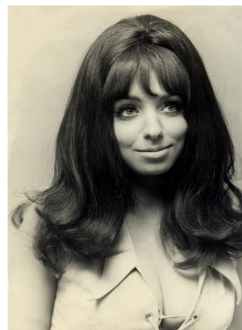
Mariska Veres (1947-2006)