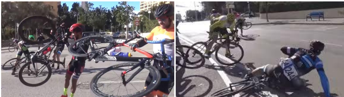
Storm blaast wielrenners van fiets in Benidorm. http://nos.nl/1/2085687

Zo waaide de wind uit een andere hoek en viel voor de renners die dag het doek vroeger dan verwacht want tegen de natuurlijke macht was geen kruid gewassen: “maok tich mèr geen dikke been (din èste maude)”.