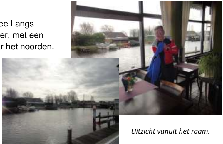
Uitzicht vanuit het raam.

Na al eerder voor een gesloten koffietent te hebben gestaan konden we op een prachtige plek te Hoogmade (De Kromme Does) ons laven aan de koffie en uiteraard appelgebak met slagroom. Hierna een calculatiefoutje.