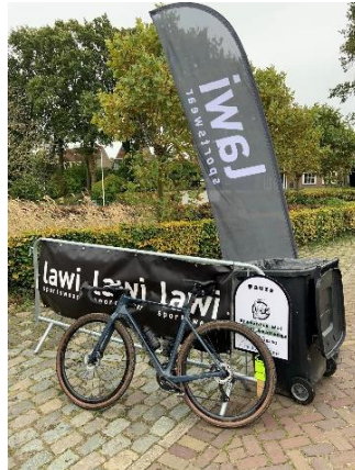
De 3 Nieuwkoopers toevallig op picture gevonden en de pauzeplaats aanduiding.

Dit effect van aan de kant gaan door het gehijg in mijn rug ging na de pauze op 55 km over, want snel erna kwam de splitsing va wegen waarbij alleen de 100 km route verder het Brabantse land intoog en de meesten de kortere routes volgden. Zo toch meer de rust bij het fietsen, wat ook de techniek meer ten goede kwam en dat was ook wel nodig door de wat uitdagendere singletrack-paadjes en meer plassen in het bosachtige terrein.