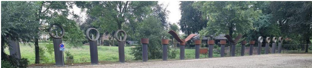
Kasteel van Haelen