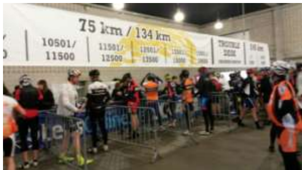
Boven de start en links de uitdaging.