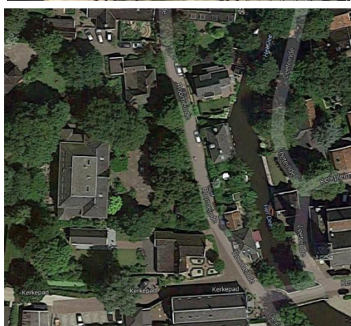
Broek in Waterland, Roomeinde3