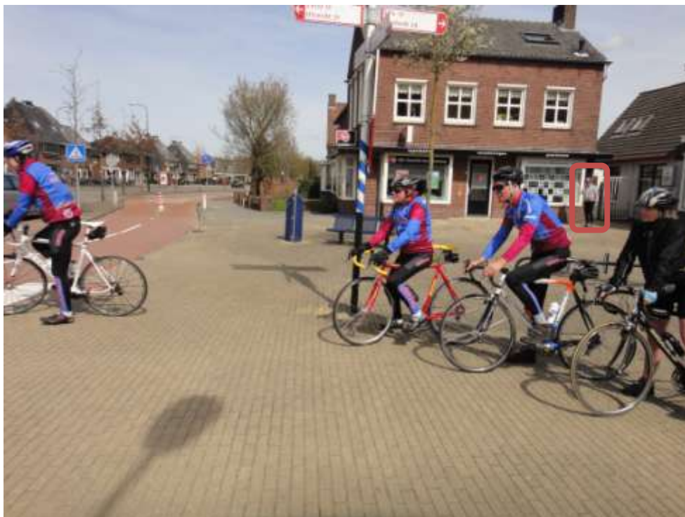
Woudenberg: 1 e telefoonpauze (zie kader).