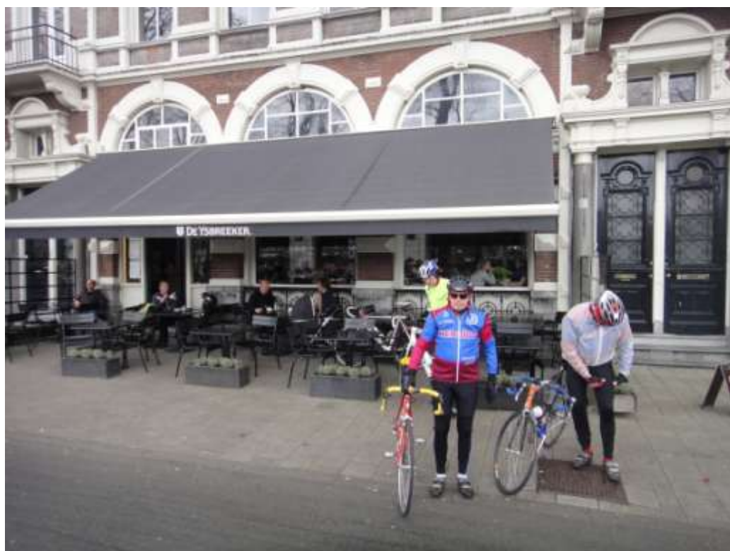
AMSTERDAM: DE IJSBREKER.