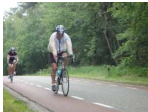
op de achtergrond de besproken dame.