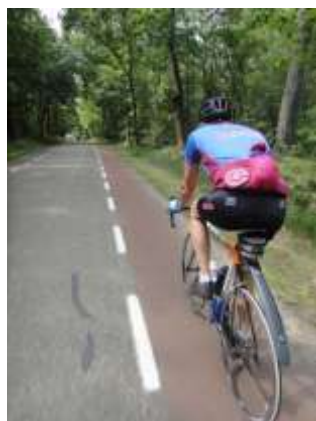
de afdaling na de 2 o beklimming.