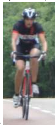
beter in beeld.

De anderen gingen inmiddels op zoek naar een plaatselijk gelegenheid om koffie te drinken. In de alom befaamde restauratie voor fietsers was het inmiddels een gezellige drukte en de koffie met appelgebak/slagroom en vanillesaus smaakte verrukkelijk.