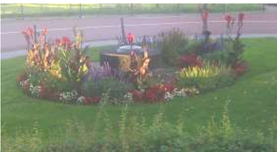
Ochtend in Vijlen, Limburg