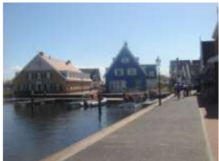
Restaurantterrein van Fletcher.