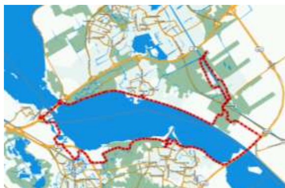
De twee bruggen in de route duidelijk herkenbaar