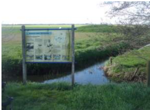
Uitzicht over de “Trilvenen”.