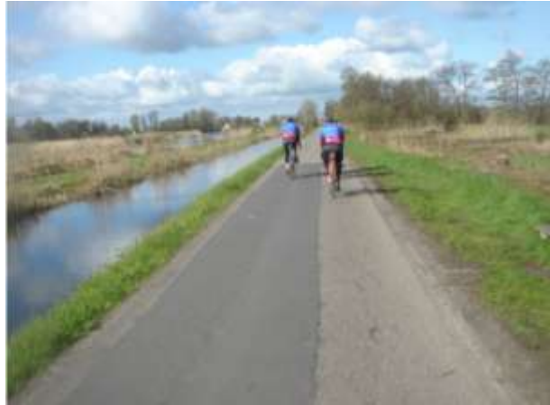
Het mooiste en natuurlijke landschap van Midden-Nederland.