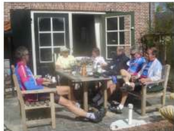
door de polder weer naar Baam