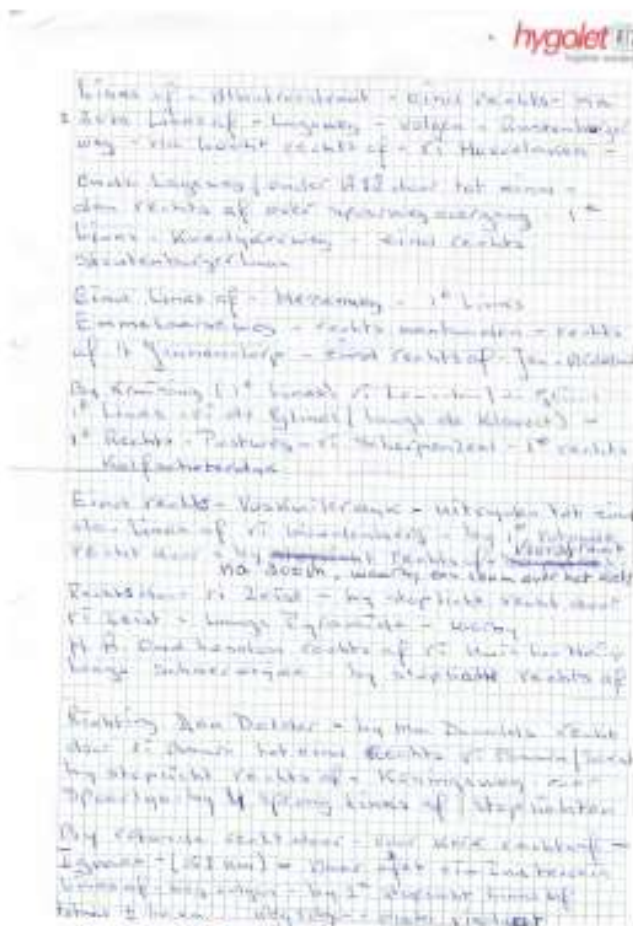
Routebeschrijving (met reclame).