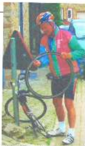
Binnen 10 meter het eerste lek. Door het teveel aan hevin lijkt het misschien dat te niet bloost.