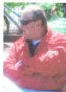
Ook de chauffeur is vermoed