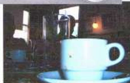
Het theekopje van Wim van Wijhe.....

Wim heeft z'n uitzonderlijk lange, dunne peval door z'n broekspijp getrokken en doet of ie nog steeds bezig is. Een herhaling laat echter zien dat wat we zagen geen straal maar een grasoor is.