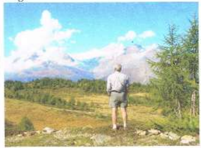
Nauwkeurig wordt het lawinegevaar berekend, een dekselse en verantwoordelijke klus.