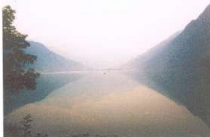
Het meer van Poschiavo in de vroege ochtend

Niet-georganiseerde activiteiten : Eigen invulling.