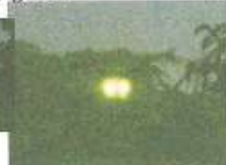
Sinds die avond houdt De Dokter zijn pand extra scherp in de gaten