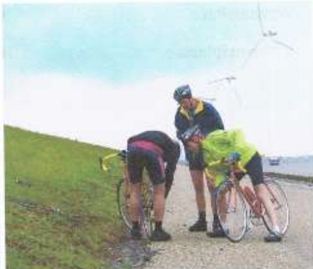
Rit 4 : lekke band 1