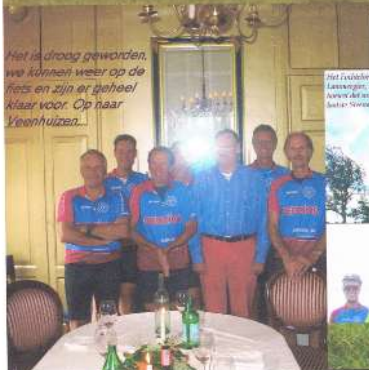
Het is droog geworden, we kunnen weer op de fiets en zijn er geheel klaar voor. Op naar Veenhuizen...

Het laatste bericht, het is eindelijk de laatste keer dat de club is geweest. Volgens een van de leden van de club, die nu in Nederland is, is de club nu in Nederland. Het is eindelijk de laatste keer dat de club is geweest. Volgens een van de leden van de club, die nu in Nederland is, is de club nu in Nederland. Het is eindelijk de laatste keer dat de club is geweest.