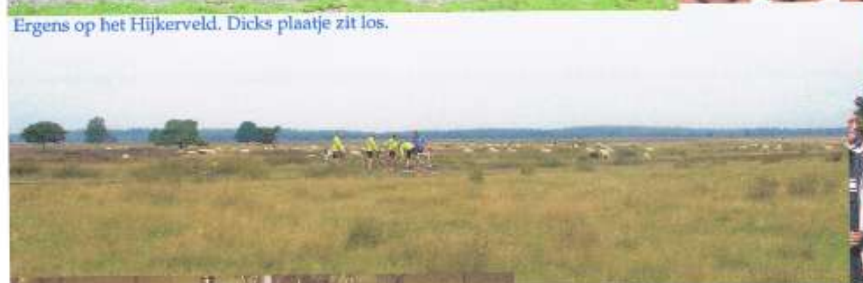
Ergens op het Hijkerveld. Dicks plaatje zit los.