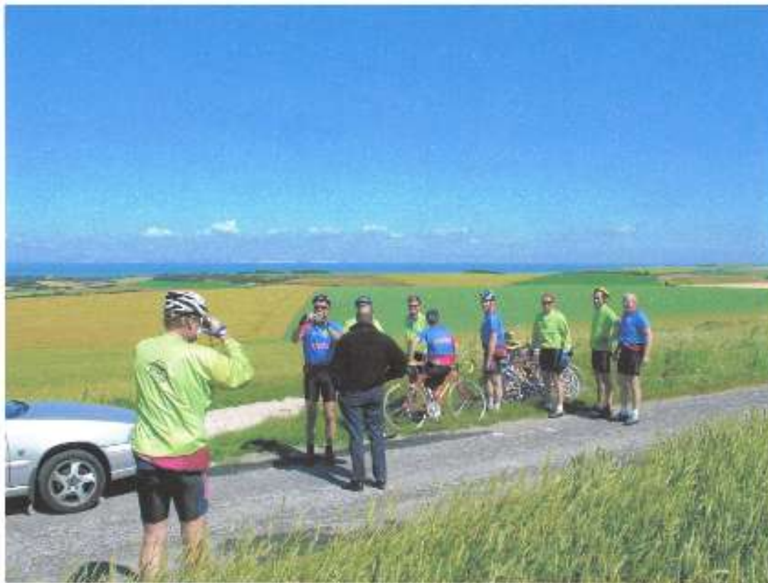
Een zondagochtend in Boulogne sur Mer,