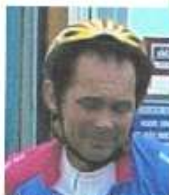
Gammelste tijd achter de nag