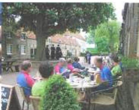
Omgeving van F's knie. Vervanging van het Cats-huis ?

Frits aan de koffie : ijs op de knie, slagroom naar de mond. Ounkijken, kijk nooit om, het ligt vooruit. Advies van een aanwezige (naam bij de directie bekend): als F. valt stap dan nooit direct op 'm toe, hij kan je zo meppende slaan, type bouwvier in nood. Commentaar Alice : drie schrammen, waar hebben we het over. Steeds meer een vrouw naar ons hart !