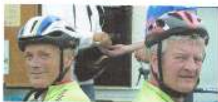
Laat ik niet merken dat jij dat ook doet !

Bij slecht weer wordt het programma ingekort tot in het uiterste geval koffie met neut.