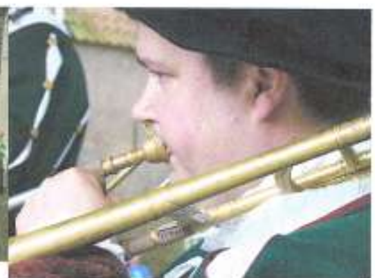
Het incident : Vlak na deze foto kon dit blazende dikkerdje opnieuw beginnen