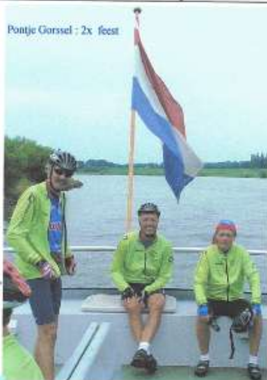
Pontje Gorssel : 2x feest