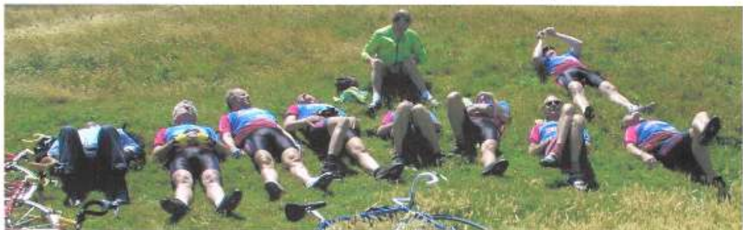
25 juni 2004, na 4½ jaar de eerste Oedziod-rustdag

Laatste nieuws : F. beweegt de vingers van z'n linker hand weer. Volgens hemzelf doet ie dat met z'n schouder. Moet jij es proberen.