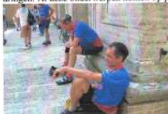
Pienza : 5 juni 2003 13.30 uur

Het voorliggende nummer van de Fietskroniek bevat in praktische zin 4 onderwerpen die binnen moeten dringen. Al deze onderwerpen komen op pag. 3 aan de orde.