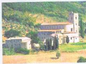
Een romantisch kleinood midden in een schilderachtig landschap: de Sant'Antimo

Rechts naast de kerk ligt de Cappella di Carlo Magno, de zogenaamde 'Kapel van Karel