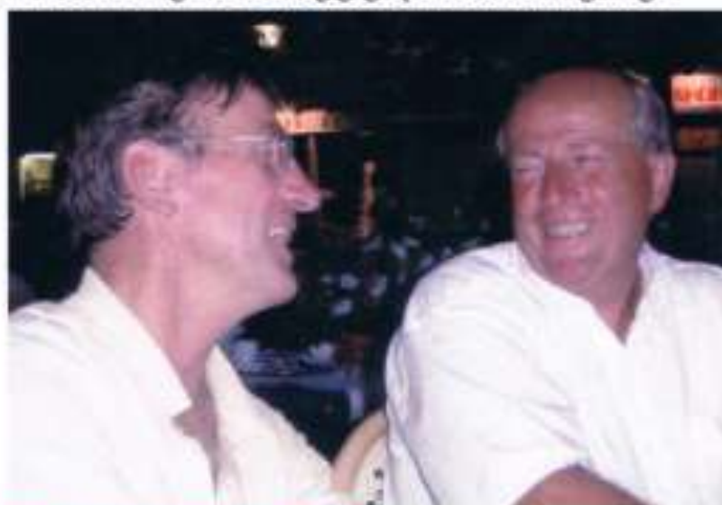
Koek en Ei genieten volop van deze feestdag.