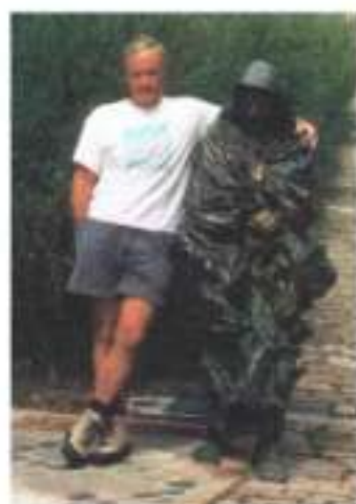
De heilige Franciscus van Assisi was gaarne bereid even met uw verslaggever te poseren.