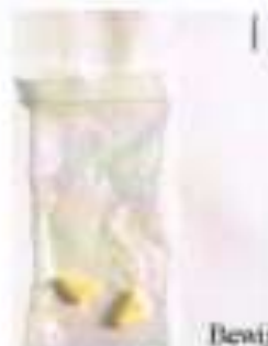
Bewijsstuk 1, ziet er bepaald niet lekker uit.