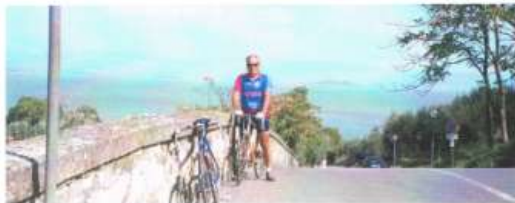
Omdat uw verslaggever 't Lago di Trasimeno in de gaten moest houden deze keer een plaatjes-de Fietskroniek