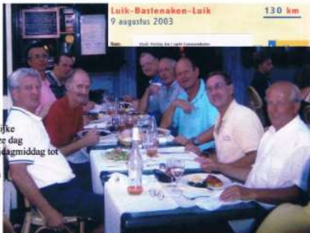
Luik-Bastenaken-Luik 9 augustus 2003

Zoals gebruikelijk is het woord compleet weer geheel ingevuld en hebben we, in innige samenwerking met de zon, er voor gezorgd dat dit bijvoeglijke naamwoord ook dit jaar aan deze dag verbonden kan blijven. Van vrijdagmiddag tot zaterdagavond hebben we er met vereende krachten hard aan gewerkt. We eindigden in ieder geval compleet uitgewoond. Ruud reed het meest perfecte parcours van ons allen en heeft gemaakt dat de enorme hoeveelheid vocht, die uit alle poriën ons lichaam verliet, spelenderwijs voortdurend kon worden aangevuld. Het reserveren van de lunch is wellicht echter nog wat te hoog gegrepen. Herkansing volgt.