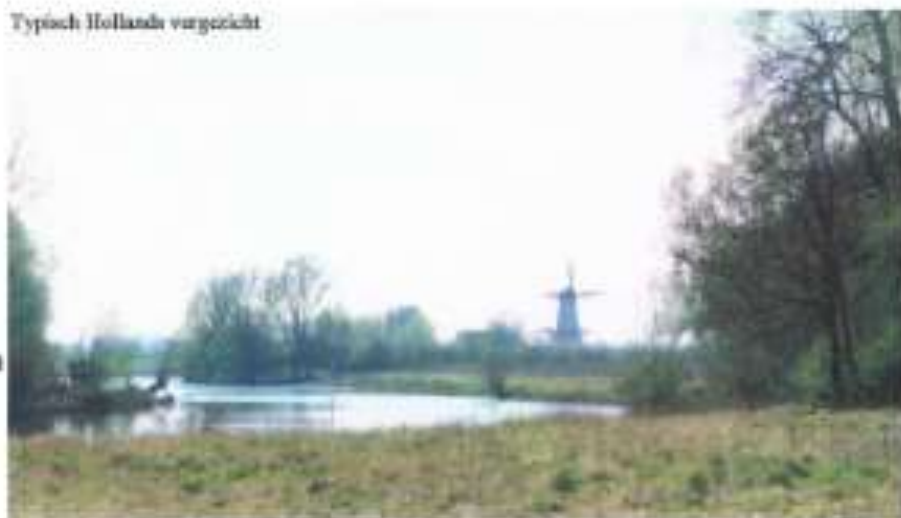
Typisch Hollands vergezicht